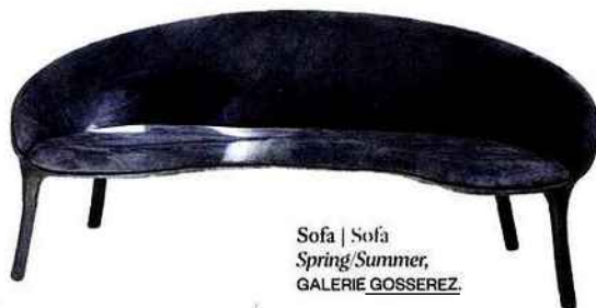
Sofa | Sofa Spring/Summer , GALERIE GOSSEREZ.

What's new. Loellmann's Spring/Summer collection has been expanded with new one-of-a-kind pieces: the brass and oak sofa plays up textural nuances and gloss, while the Blocks table, with its carbonized wood top perched on copper and brass bricks, reveals his taste for contrasts. I.F.